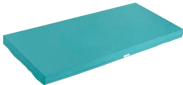
メディマツト医療用 フルサイズ