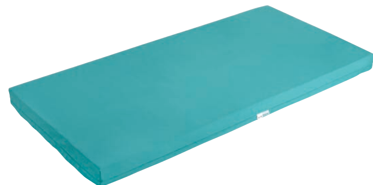
メディマツト医療用 フルサイズ